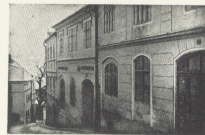
Pohled na budovu městského hudebního ústavu

Myšlenka zřídit ve Vimperku oficiální umělecké vzdělávání (tehdy hudební ústav) se objevila hned po druhé světové válce. Počátky však provázelo nemálo problémů. Podrobně jsme vše popsali v almanachu k 70. výročí založení uměleckého školství ve Vimperku v roce 2019. Protože se v tomto roce dočkáme největšího rozšíření a naše škola se v průběhu své existence ve Vimperku mnohokrát stěhovala, rozhodli jsme se, že vám důležité momenty v tomto ohledu přiblížíme.