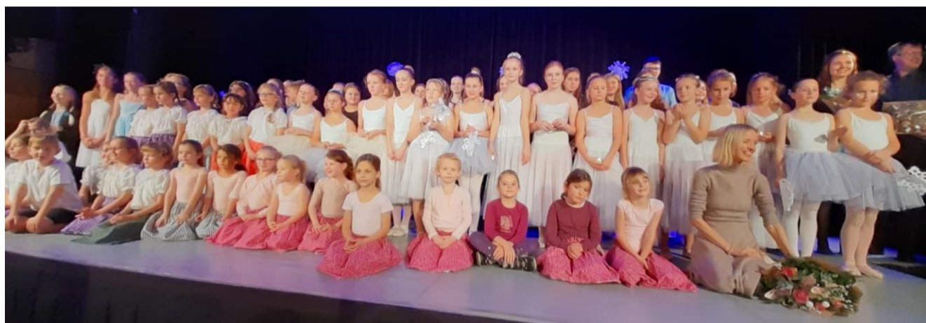
Předvánočnímu vystoupení žáků tanečního oboru a pěveckého sboru aplaudoval zaplněný sál MěKS.