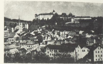
Vimperk na Šumavě