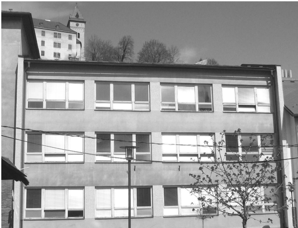
Pódia koncertních sálů školy – vlevo v budově „zámečku“, vpravo v budově „gymnázia“.