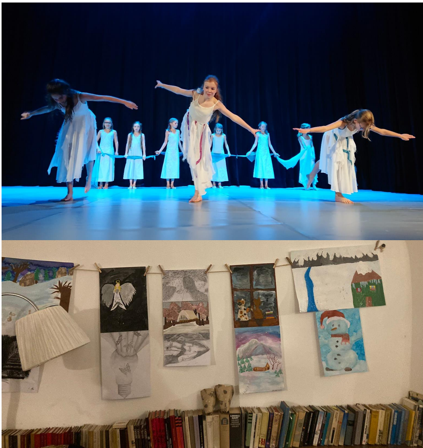
Fotografie z vánočního vystoupení tanečního oboru v MěKS a listopadové výstavy výtvarných prací v Kavárně Ve Skále.